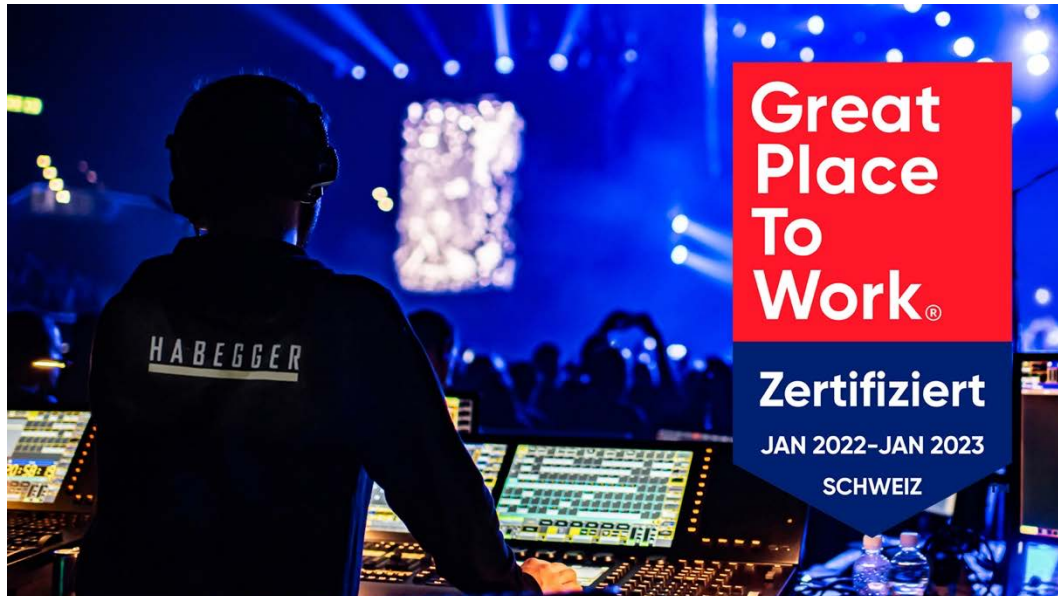
Habegger wurde 2022 zum zweiten Mal als «Great Place to Work®» ausgezeichnet.