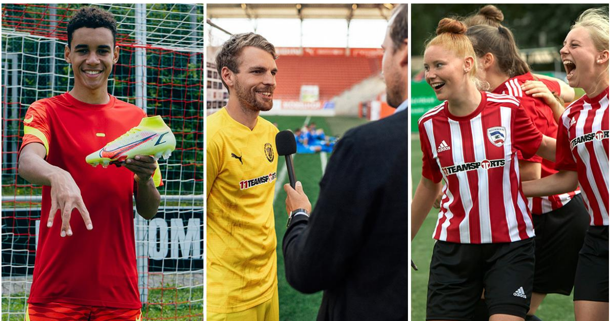
Bild: 11teamsports feiert mit drei Teamsport-Kampagnen den Saisonauftakt und huldigt dem Amateurfußball (v.l.n.r. Nike, Puma, Adidas).

Allen drei Teamsport-Kampagnen, die 11teamsports strategisch unter einem Teamsport-Dach vereint, ist gemein: Sie huldigen dem Amateurfußball, spiegeln die vielfältigen Emotionen und die Bedeutung von Teamsport für Spieler und Teams wider. In jeder der drei Kampagnen fließt – auf jeweils unterschiedliche Art und Weise – auch der übergreifende Ansatz von 11teamsports „Everybody is a Pro“ mit ein.