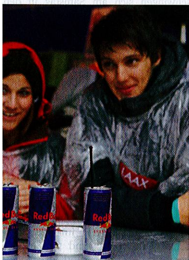
Sponsoren sind allgegenwärtig.