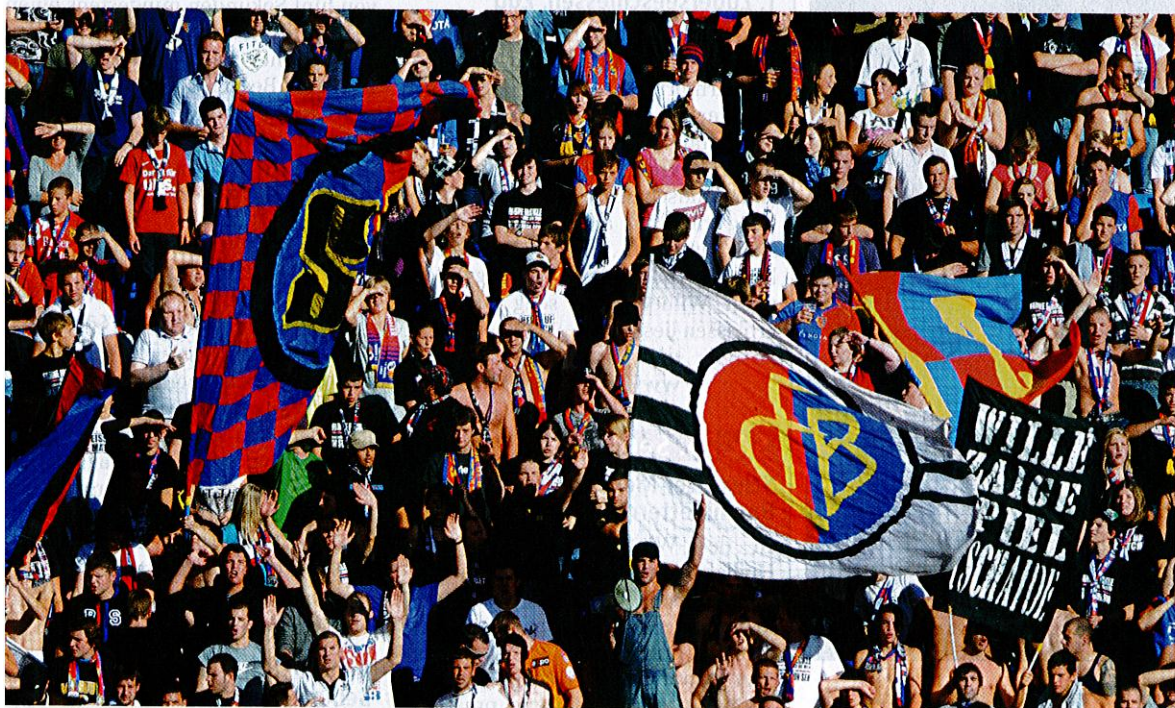
Nicht nur im Stadion wie hier, auch im virtuellen Raum hat der FC Basel viele Fans.

Nicht nur auf dem Rasen ist der aktuelle Schweizer Meister erfolgreich, auch bei Facebook ist der FC Basel mit fast 13 000 Anhängern Fan-Meister.